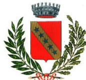
Comune di Remanzacco