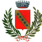
Comune di Remanzacco