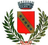
Comune di Remanzacco